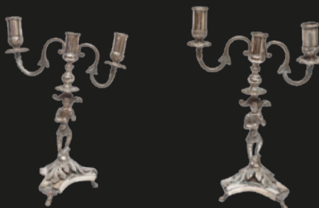
Candelabros de plata para 3 velas, 1353 grs. c/u