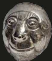
Conjunto de 5 máscaras de Carnaval con figuras antropomorfas de plata colonial, Perú, S. XVII.