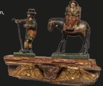
Imagen de la Huida a Egipto, en madera policromada, 19 x 23 cm, Quito, S. XVIII.