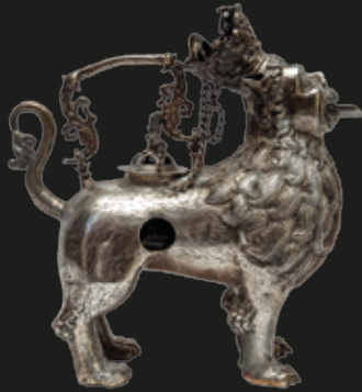
Pava con hornillo en forma de león de plata labrada, 3 kg. aprox., Perú siglo XVIII.