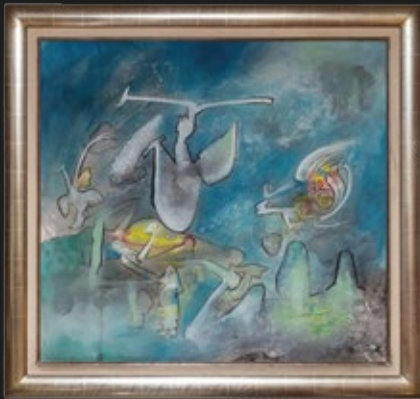
Roberto Matta, "Composición Abstracta", óleo sobre tela, 96 x 89 cm, firmado y certificado.