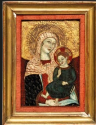
Anónimo, "Virgen y el Niño", óleo sobre madera, 18 x 27 cm, Italia, S. XVI.