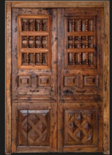
Par de puertas diamantadas con postigo superior y reja de carretillas, 68 x 213 cm, Chile, S. XVIII.