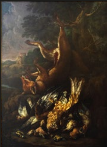
Angelo Maria Crivelli (II Crivelone), par de bodegones con aves y animales después de caza, óleo sobre tela, 96 x 132 cm cada uno, 1738.