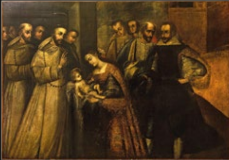
Anónimo, "Santo Domingo bendiciendo a un niño después de sanarlo", óleo sobre tela, 220 x 157 cm, serie de Santo Domingo, S. XVII.