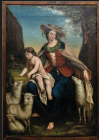
Anónimo, "Advocación de la Divina Pastora", Escuela Cuzqueña tardía, fines del S. XVIII.