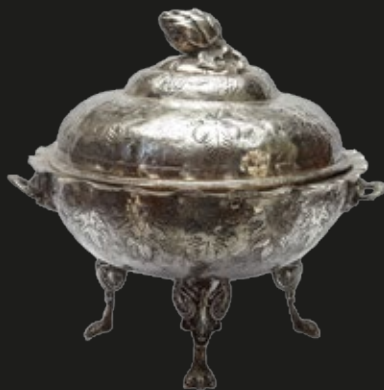
Gran sopera de plata labrada, 37 cm (ancho) x 35 cm (altura), Bolivia, fines del S. XVIII.