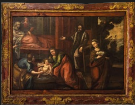
Escuela Cuzqueña, "Natividad de la Virgen", óleo sobre tela con marco tallado y policromado de época, 156 x 101 cm, S. XVIII.