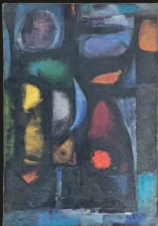
Nemesio Antúnez, "Composición Abstracta", óleo sobre tela, 55 x 39 cm, firmado.