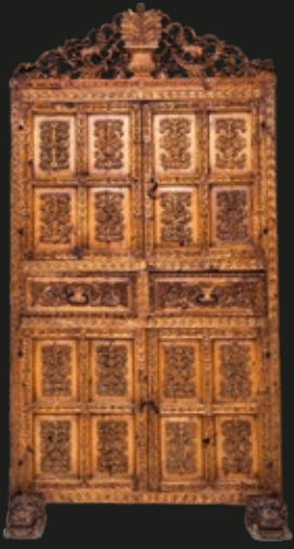
Alacena de madera tallada con puertas y cajones, 59 x 112 x 215 cm, Perú, S. XVIII.