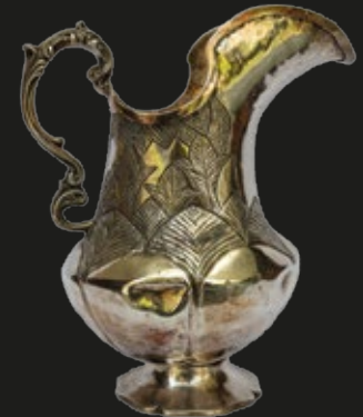
Jarra de plata colonial con cuerpo repujado y asa Rococó, 20 cm (ancho) x 24 cm (altura) con el asa incluida. Alto Perú, S. XVIII.