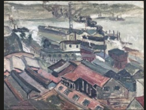
Camilo Mori, "Puerto", óleo sobre tela, 38 x 50 cm, firmado.