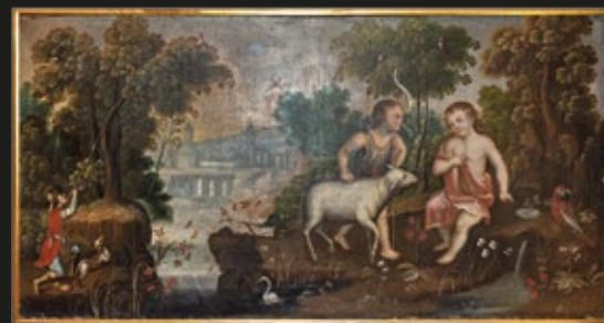
Escuela Cuzqueña, "Jesús y San Juan Bautista jugando con un cordero", S. XVIII.