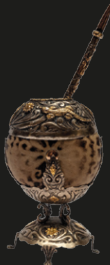
Mates coloniales de plata, algunos con incrustaciones de oro, salvilla y bombilla, Alto Perú, Chile y Argentina.