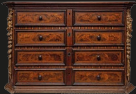
Cómoda italiana taraceada en madera frutal, 4 cajones, uno con escritorio y gavetas interiores, aplicaciones laterales con querubines, 152 x 64 x 100 cm, Florencia, S. XVIII.