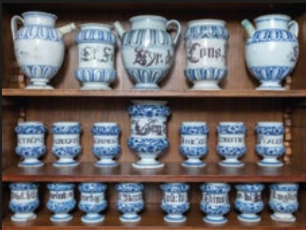
Colección de 3 jarras y 17 frascos de farmacia catalanes, S. XVII.