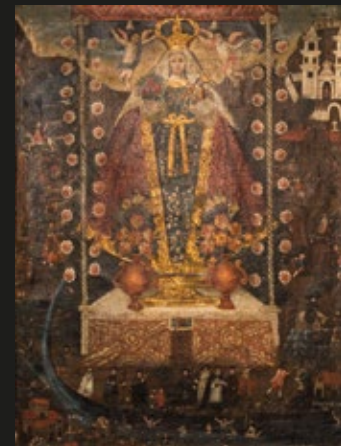
Anónimo, "Advocación de la Santísima Virgen de Cocharcas", Escuela Cuzqueña, óleo sobre tela, S. XVIII.