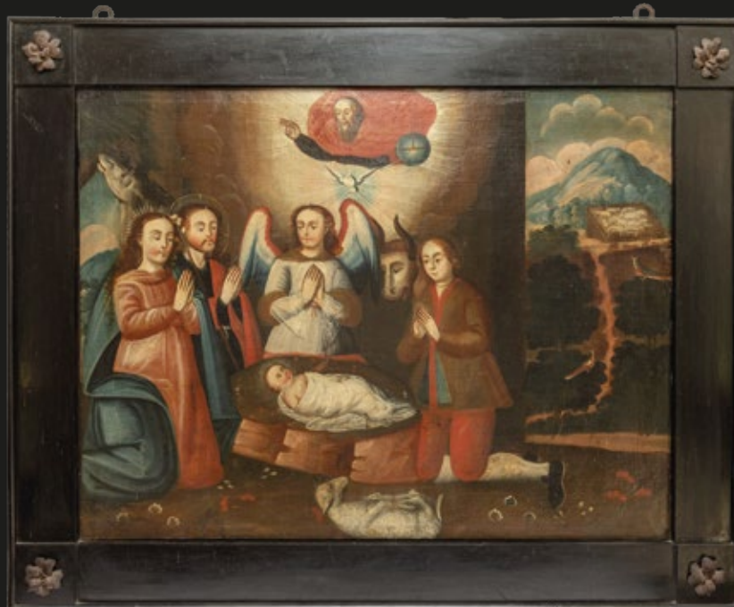
Maestro de Mendoza, "Nacimiento", óleo sobre tela, 98 x 75 cm, Escuela colonial chilena, S. XVII.