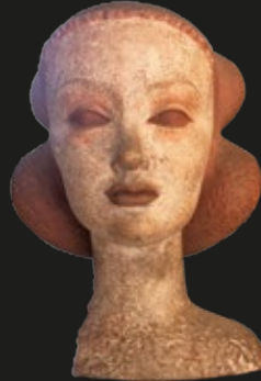
Samuel Román, "Alicia", terracota, 32 cm (altura), firmado, 1948.