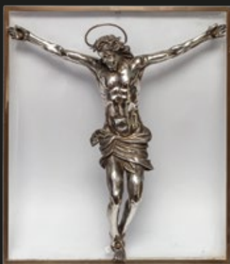
Figura de Cristo en plata cincelada, factura Europea siglo XVII, 45 cm.