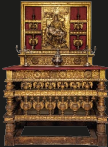
Altar plateresco en madera dorada estilo barroco, 70 x 140 x 217 cm, Perú, S. XVII. Perteneció a la capilla del fundo Lo Águila de propiedad de la familia de Toro Herrera.